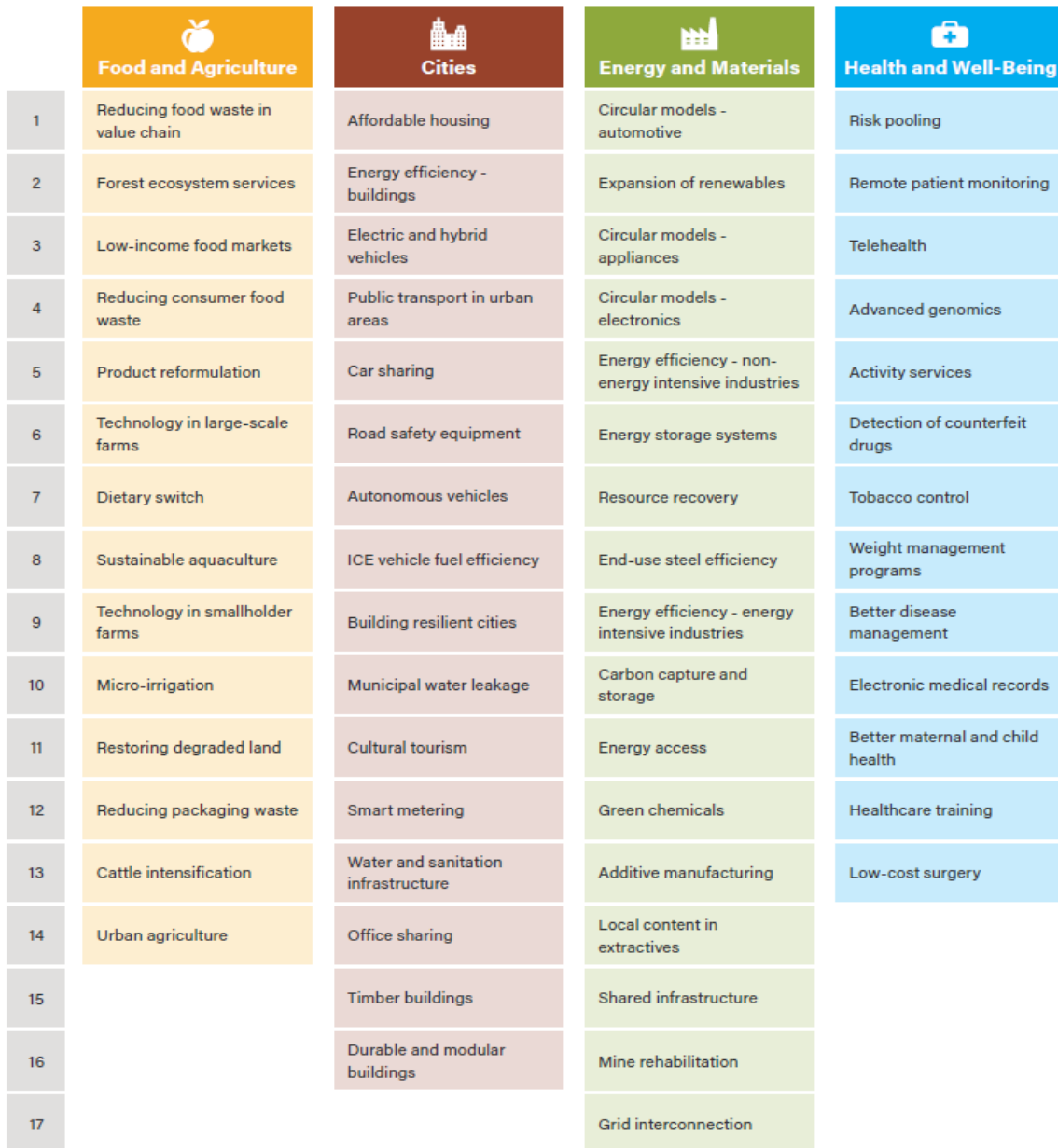
圖 1 永續商機具潛力投資項目