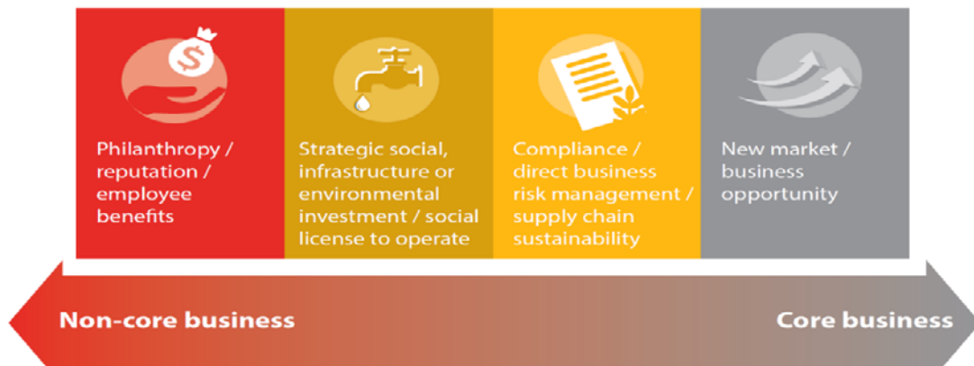
圖 2 企業參與國際發展合作的誘因

資料來源：UNDESA-The SDG Partnership Guidebook