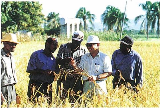
▲我農技專家指導海地農業人員水稻田間實習—去偽去雜