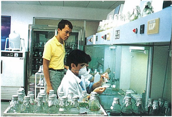
▲我農技人員指導哥斯大黎加職訓局講師無菌操作工作