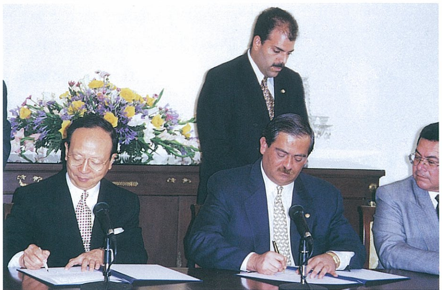
▲外交部章部長孝嚴與薩爾瓦多外長龔薩雷斯簽署中薩經技合作備忘錄

本會透過貸款、技術協助及教育訓練等援助，已和全球九十餘國建立良好之聯繫管道與工作關係，未來在資金充裕情況下，將擴大對外合作範圍，以充分發揮對外合作功能，達到「加強國際合作，增進對外關係，以促進經濟發展、社會進步及人類福祉」之設立宗旨。