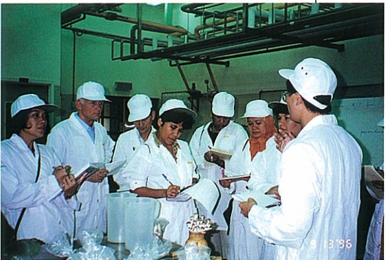
▲農業加工講習班—受訓學員參觀新竹食品工業發展研究所菇類加工情形

品製作、交通建設、印刷及醫療服務等，以改善駐在國人民生活水準、協助其經濟發展促進瞭解及增進邦誼。