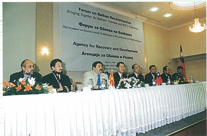
前進巴爾幹半島，協助馬其頓經濟發展，是本會配合外交需要，積極規劃之重點工作。

民國八十五年一月十五日公布實施之「國際合作發展基金會設置條例」，建立我國統一援外業務機構之法制基礎。惟該條例僅規範國合會之設置及運作，為使我國援外事務更加法制化及透明化，以因應民意之要求，制定「國際合作發展法」已有客觀與事實上之需要。外交部參酌先進國家相關做法，配合我國之實際情況，已草擬「國際合作發展法此草案」，現正徵詢民意及相關機關之意見，以研究納入法案中，期於本年底前途請行政院核轉立法院審議。希望藉此法案之通過，使我國援外工作邁入一個新的里程碑，本會自當配合推動。