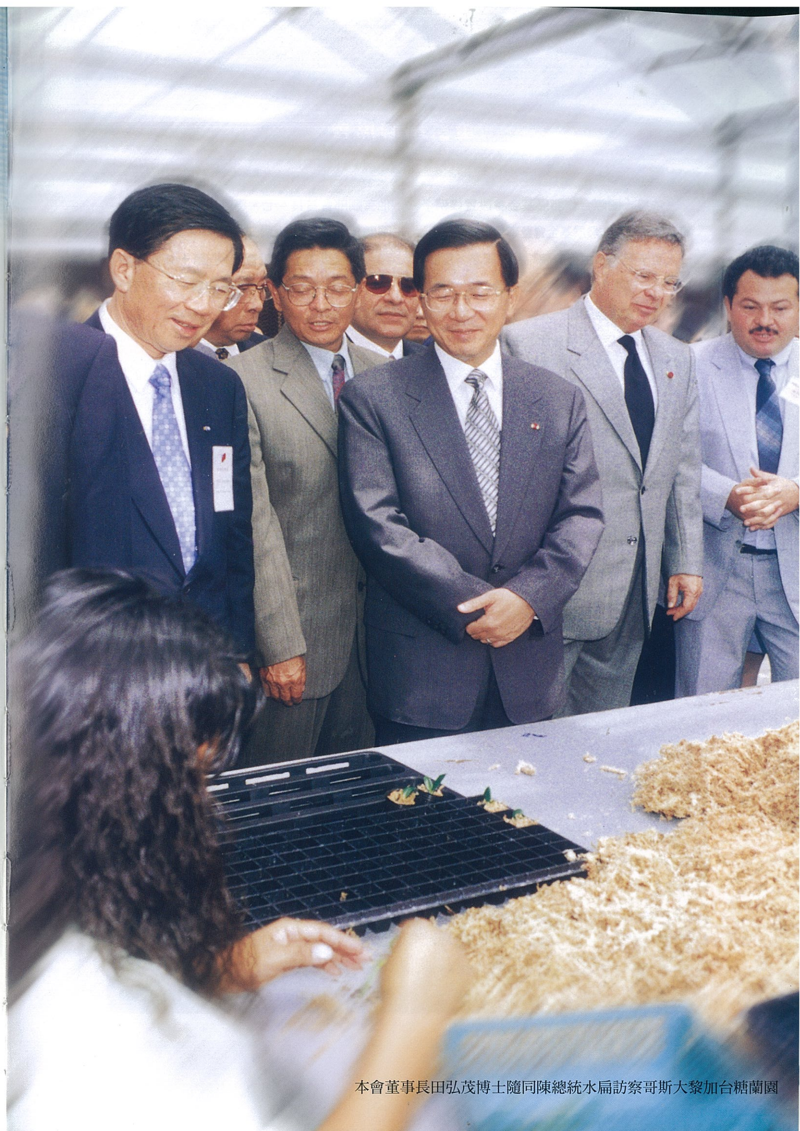
本會董事長田弘茂博士隨同陳總統水扁訪察哥斯大黎加台糖蘭園