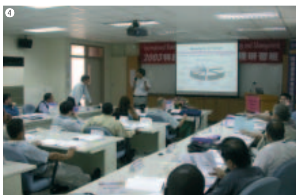
① 禽畜類防疫與檢疫研習班電腦實習課程 ② 社區營造與觀光產業發展研習班學員參訪高雄市河川整治工程 ③ 中美洲五國科技整合能力建構計畫 ④ 科技產業政策與管理研習班學員聽取台灣科技產業發展情形簡報