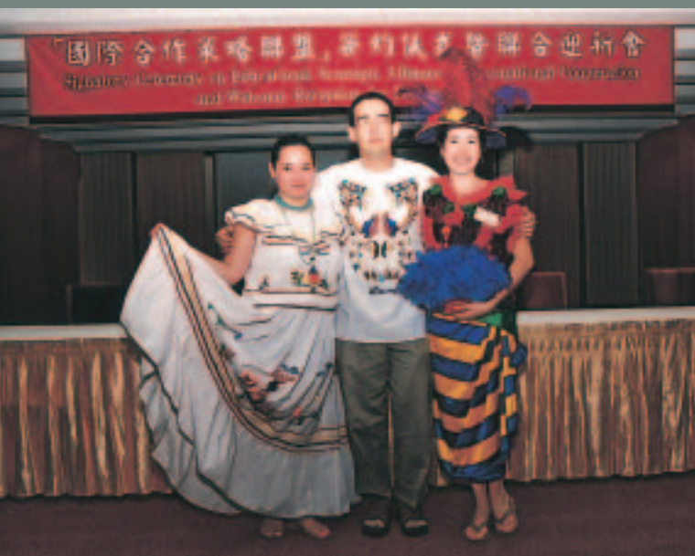
國際高等專業人才養成獎學金計畫學員

不論就我國拓展多元外交途徑，抑或協助友邦國家逐步邁入永續發展的坦途而言，國際人力資源發展無疑都扮演了一項關鍵性的角色。台灣係舉世公認由開發中國家轉型至新興工業化國家的罕見成功範例，亦是東亞第一個和平政黨輪替的政治民主國家，在各方面都有傲人而珍貴的成就，卻因為特殊的國際孤立情勢，而未受到應有的討論及重視，殊為可惜。