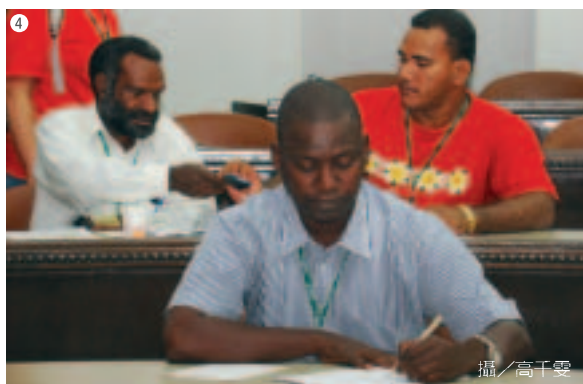
①亞太地區國合之友會第一屆會員大會 ②熱帶與亞熱帶地區漁業永續管理研習班學員於水產試驗所聽取簡報 ③薩爾瓦多中學教師推演與台灣中學進行視訊交流的流程 ④社區營造與觀光產業發展研習班學員上課情形