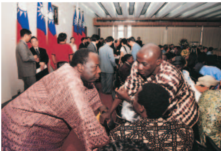
國際高等專業人才養成獎學金計畫學員，於國際合作策略聯盟簽約典禮中熱絡地交流。

本會國際人力資源發展，亦依循此一大方向，每年不斷思考如何深化既有的業務成果，同時提出更多的創新提案，從各個面向彰顯台灣成就的同時，達成發展國際人力資源的最大效益。