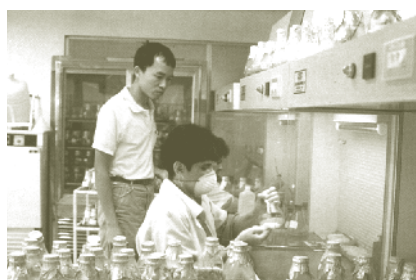
駐哥斯大黎加農技團指導職訓局人員蘭花組織培養技術