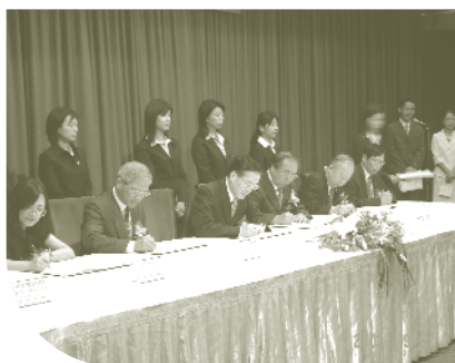
與國內六所大學簽約成立「國際合作策略聯盟」培養友邦專業人才