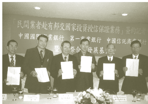
與國內商業銀行合作開辦「民間業者赴有邦交國家投資授信保證業務」