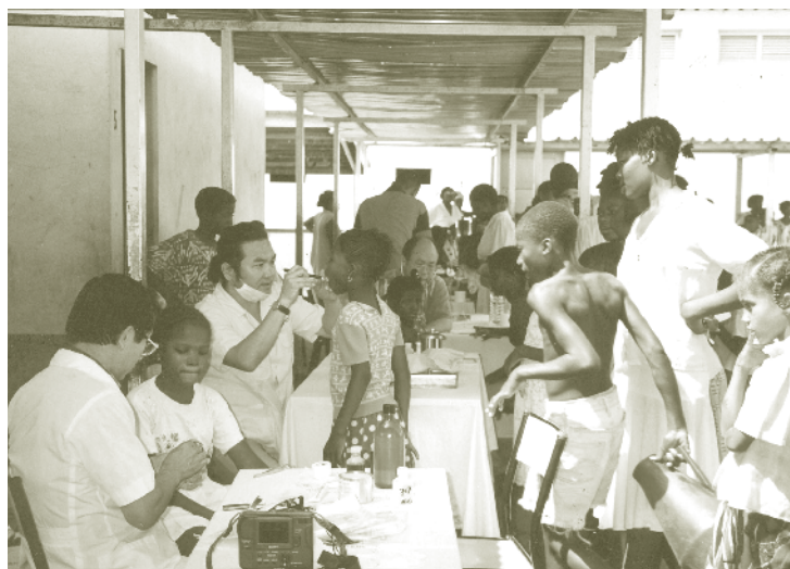
駐聖多美普林西比醫療團辦理巡迴義診