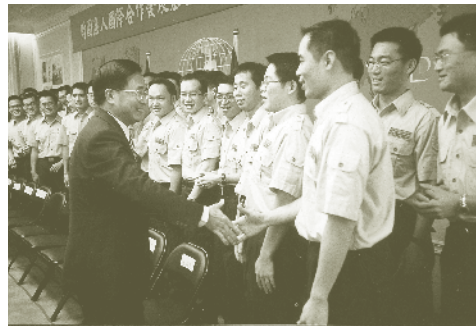
陳水扁總統期勉第一屆外交替代役男能貢獻所學及熱情為合作國家人民服務