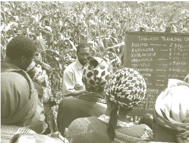
駐史瓦濟蘭技術團舉行玉米田間觀摩會