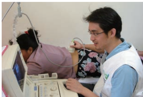
▲行動醫療團醫生為一名吐瓦魯婦女進行超音波檢查

綜觀國際醫療援助模式，除了針對發展中國家貧病現象推動長期、在地化的醫療及公共衛生改善計畫之外，另包括因應天災戰亂的緊急且短暫的醫療援助。由於天災戰亂往往造成極大的財務損失與死傷，國際間亦投入相當龐大的人力