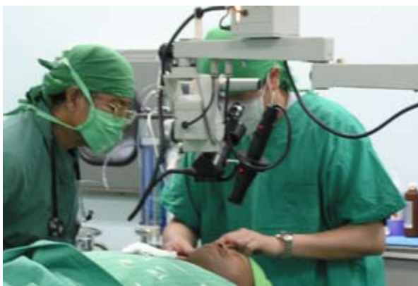
▲吉里巴斯行動醫療團為當地病患切除臉部腫瘤

聯合國開發計畫（UNDP）所提出的「人類安全」觀念，強調取得基本生存所需是每個人應享權利，此正好符合本會「以人為本」的組織信念。未來本會將秉持人道精神與關懷本質，以更多元的國際合作模式協助發展中國家改善公衛體