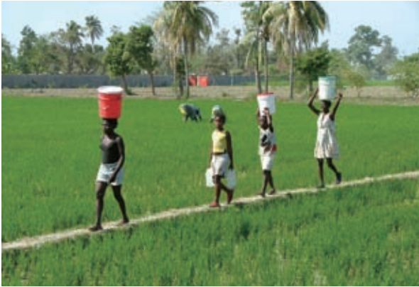
▲駐海地技術團稻作推廣區景象

在具體作法上，主要係派遣由專業人員組成之技術團隊常駐於合作國家，規劃及執行各項農業發展計畫。目前本會於非洲、中南美洲及亞太地區共29國派駐技術團，推動農、漁、牧、加工等多項計畫，執行包括新品種引進（改良）、