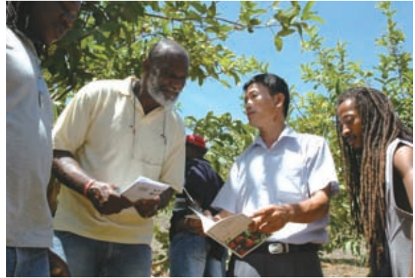
▲駐聖文森技術團專家指導農民蓮霧栽培技術