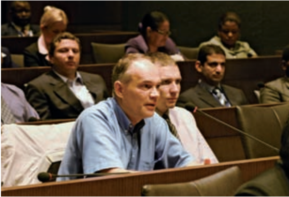
▲台灣經建發展研習班學員上課情形

中小型企業發展經驗，並結合我國政府及私部門的資源提供合作國家必要之協助，透過與執行單位的密切討論擬訂適合當地需求的計畫，以適切地轉移技術與知識，協助合作國家建立穩健的經濟環境與永續的發展模式。