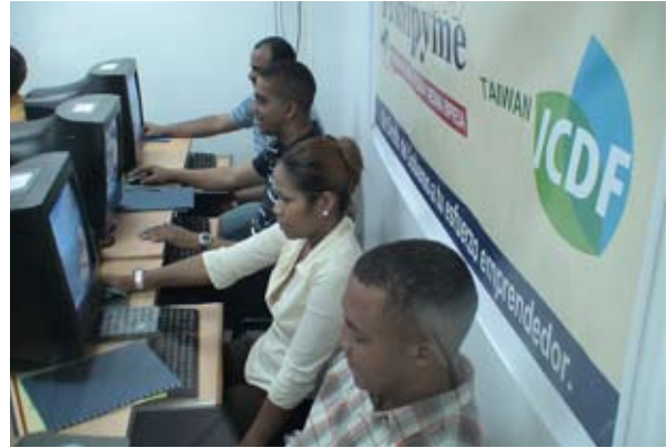
▲駐多明尼加工業服務團舉辦電腦操作訓練班

Information System, GIS) 為主題開辦研習班，引介遙測與地理資訊系統等資訊應用技術，協助合作國家奠基國土資源規劃、自然環境監測，以及城鄉發展等牽繫國家永續發展的重要領域。