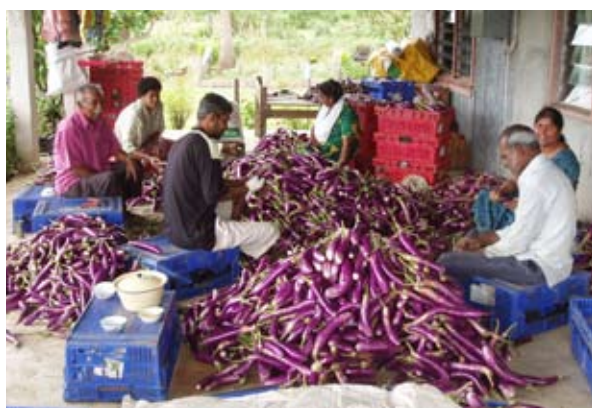
▲駐斐濟技術團輔導農民蔬果栽培及分級包裝技術

期並增加農產初級產品的附加價值。例如於布吉納法索興建灌溉系統、闢築稻作墾區、引進高產品種及推廣栽培技術，以提升稻作產量，以及於馬拉威輔導玉米集團生產並設立小型碾粉廠，藉此輔導農民逐步由農產自用進而創造現金收入，提升生活水準。