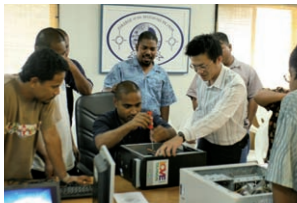
▲台灣專家指導馬紹爾學員電腦組裝技術

為協助合作國家轉化資通訊科技為發展動力，本會於甘比亞、巴拿馬、貝里斯等國推動政府e化工程，促進公用領域資訊的獲得管道及透明度，以提升政府治理效能及服務效率。同時配合ADOC計畫開辦「中小企業暨個人e化創業經驗分享營」，強化亞太地區及秘魯、智利等國企業資通訊技術運用能力，以網路行銷拓展客源、降低創業與企業經營成本，並創造數位商機。此外，2006年首度以地理資訊系統（Geographic