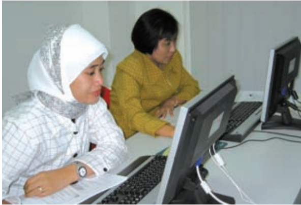
▲APEC數位機會中心計畫於印尼辦理資通訊訓練課程