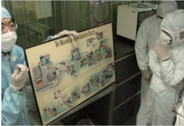
▲數位落差研習班學員參訪半導體實驗室，聆聽專家解說製造過程