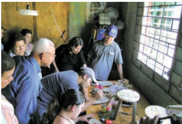
▲駐薩爾瓦多技術團職訓計畫配合薩國產業發展需求培訓當地人才

因應國際社會重視援助效益及在地化（ownership）的趨勢，本會的發展策略著重於協助合作國家培養自立發展的能力，強調能力建構（capacity building），並尊重合作國自身的政策優先項目及體系，以協助、諮商、監督的角色幫助合作國改革、強化體制。因此特別注重與合作國相關單位，包括政府部門、地方團體、非政府組織，以及個別民衆的溝通說明，提升援助計畫的效果，並落實在地化的目標。