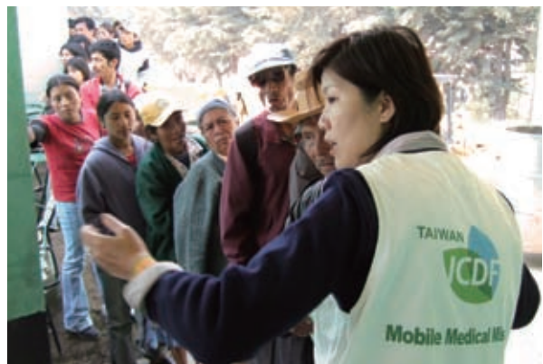
▲行動醫療團前往瓜地馬拉，為長期飽受醫療資源不足之苦的偏鄉民眾提供及時的醫療服務

痛，亦為偏遠鄉間衛生所提供必備藥品與衛生醫療器材，並藉由診療過程的詳細解說帶給當地民眾正確及基本的衛生常識，另透過手術示範教學讓當地醫護人員得以提升專業知識，為發展中國家的醫療體系注入新力量。