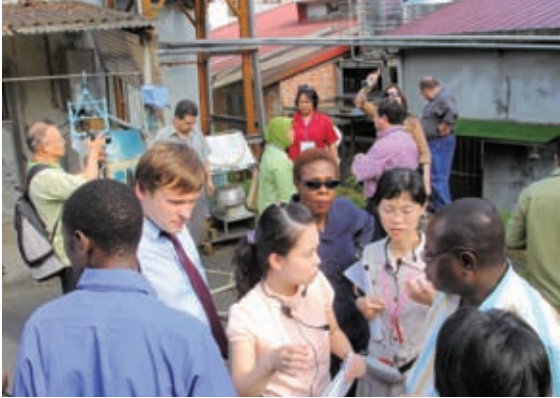
▲直接分享台灣成功的經驗，成為各類研習班廣受好評的重要因素

培育體制。此外，中長期的科技應用人力培育亦為重要的協助策略，國合會透過與清華大學等國內科技領域翹楚的合作，推動以英語授課之「科技管理」及「資訊科技」碩士班，提供友好國家的年輕科技菁英兩年全額獎學金及來台攻讀碩士學位，協助友邦培育科技發展的政策及技術人才。此一人力發展計畫不僅可培植友好發展中國家資訊科技產業創新與服務人才，同時兼具推動我國大學國際化的效益。