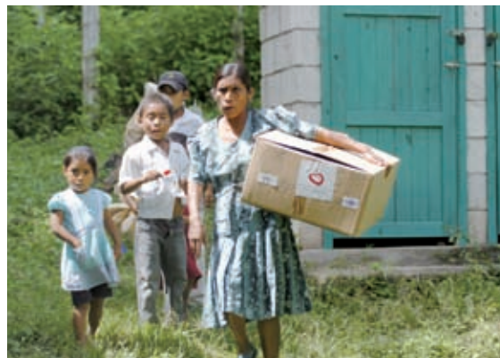
▲全球合作促進發展，共同朝向「脫貧」與「自立」的目標前進

當世界越趨緊密整合，各國的互賴與依存度也因此更加深化，透過合作與集體行動來解決共同問題也更為迫切。身為地球村的一份子，面對全球化浪潮席捲而來的各項挑戰，單一政府與單一視野的解決仍力有未遑，因此善加結合各國際與非政府組織，集