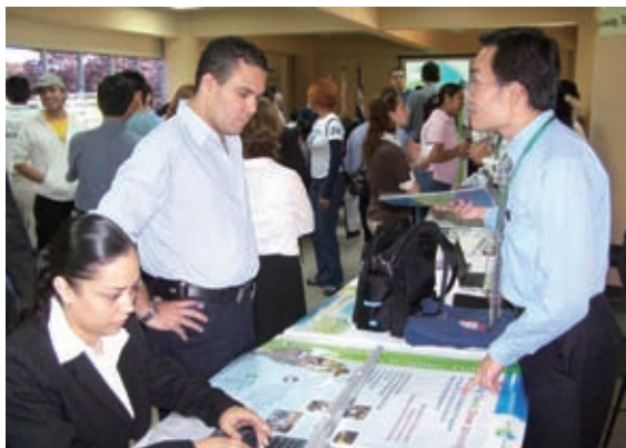
▲高等教育獎學金計畫說明會前進海外，引入台灣經驗為友邦國家培育人才

此外，國合會自1998年創設高等教育獎學金計畫（即外籍生獎學金計畫），與國內大專院校合作設立，設立以英語教學的大學、碩博士學程，提供全額獎學金鼓勵發展中國家優秀具潛力的學生來台就讀，透過一系列符合發展中國家社經需求的課程，並藉由國內高等教育機構的教學系統，協助發展中國家培育熱帶農業、經營管理、人力資源、水產養殖、電機工程、衛生醫療、環境發展、精密模具、護理及土木工程等專業人才。更重要的是，藉由高等人才的培訓機制，不僅把國外的菁英帶進台灣，為國內高等教育的國際化添注前進動力，也把台灣的高等教育