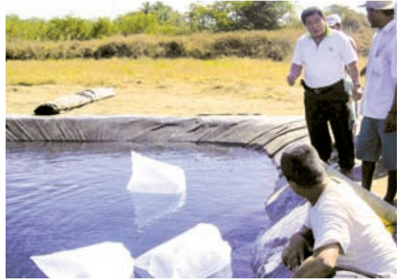
▲糧食濟貧組織的資金，配合技術團的技術協助——多元參與的合作模式就此開啓

國合會與糧食濟貧組織的合作始於2005年的宏都拉斯吳郭魚養殖計畫，因計畫成效顯著，雙方續於2006年2月針對合作模式及範疇進行討論，協議透過農業生產、吳郭