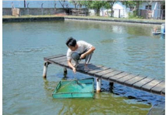
▲透過印尼合作社銀行的網路，提供當地漁民購置生產資材所需的資金

除了前述結合自身技術團資源，或與當地的金融機構及非政府組織進行合作之外，國合會也與國際發展機構建立夥伴關係，共同合資執行微額貸款計畫，發揮資金的槓桿效用，也