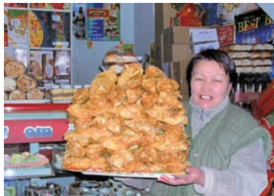
▲與歐銀的各項合作計畫，嘉惠無數中東歐及中亞地區之人民

有鑒於此，國合會自1996年起與歐銀合作進行各項融資計畫，如經由「白俄羅斯中小企業轉融資計畫」獲得與白俄羅斯中央銀行