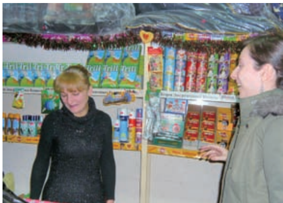
▲喬治亞Procredit銀行行員訪視寵物用品店女老闆使用國合會貸款狀況

未來，國合會將持續關注不同領域的微額貸款需求，針對各項發展計畫的潛在受益人，適時導入合宜的微額貸款機制，以擴大原有計畫的援助效益；同時，也透過合作網絡開發符合當地發展目標的微額金融計畫，以提高微額金融服務的廣度及深度。最終，期待能利用微額金融機制，將資金穩健且安全地交予需要的人作最有效的利用，讓他們能夠獲得一個機會，一個脫離貧窮的機會，最後達成協助全球貧窮人口除貧解困的最終目的。