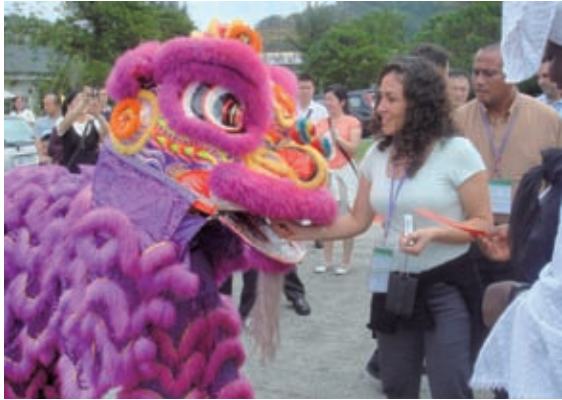
▲參與「社區營造與觀光產業發展研習班」之學員，近距離與台灣文化做面對面的接觸