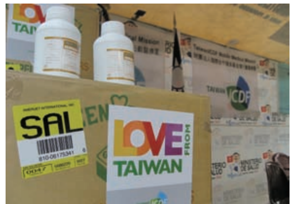
▲隨著醫療專業行動服務，來自台灣的愛心將深入全世界每個需要的角落

衛生醫療合作是一條長遠的道路，國合會將持續運用台灣在發展過程中累積的豐厚醫療實務經驗，以自主培力的方式，協助開發中國家開發醫療專業人力資源並促成制度面的技術轉移及興革，展望未來將更靈活地整合資源，尋求更多夥伴與資源投入，共同參與國際衛生醫療合作工作，有效地協助受援國提升公共衛生環境與醫療照護品質，達成協助合作國家強化衛生醫療人員及機構能力的目標。