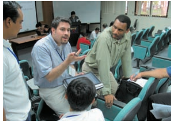
▲「縮減數位落差研習班」提供各國學員一窺台灣推動數位科技的機會，也成為彼此交流的平台