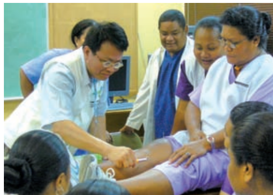
▲行動醫療團的派遣不僅提供診療服務，更透過臨床示範教學訓練當地醫護人員，積極提升友邦之醫療水準

另外，針對具有發展潛力並值得長期培訓之醫事人員，本會另提供碩、博士課程獎助學金，與國立陽明大學、國立台北護理學院、高雄醫學大學合作開設「國際公共衛生學程碩博士班」、「國際護理碩士班」及「臨床醫學碩士班」，協助培訓高等醫療專業人才。這些專業能力獲得提升的醫療人員，也將在學