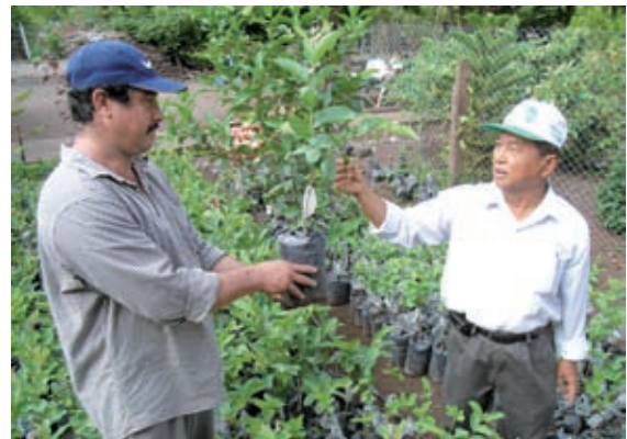
▲成功的農業發展，引領台灣順利開拓發展援助的志業

以合作業務範圍蓋括觀之，國合會與國際各式組織的合作領域，主要分為「投資融資」、「技術合作」、「國際人力發展」以及「人