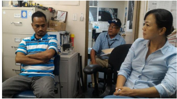
圖說：MEC 資深技師說明太陽能設備之成本