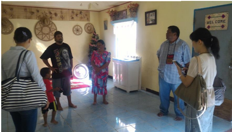
圖說：參訪一有意申貸之中低收入家戶