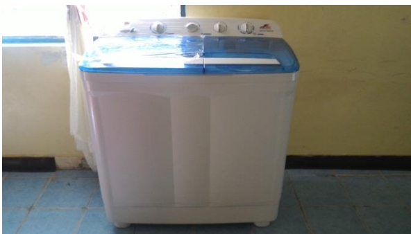
圖說：新添購之洗衣機，無節能標章