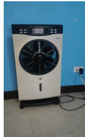
圖說：電扇，無節能標章