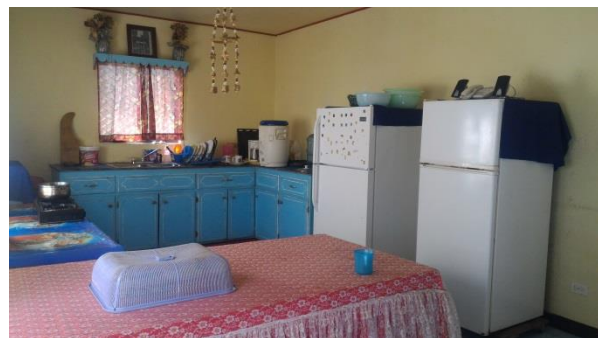
圖說：新舊冰箱，無節能標章