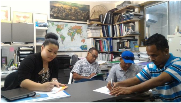
圖說：有意申貸之 MEC 員工正在填寫問卷