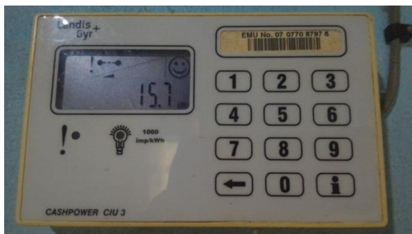
圖說：MEC 裝設之預付電表，當額度足夠時會顯示笑臉，即將用罄時會顯示哭臉