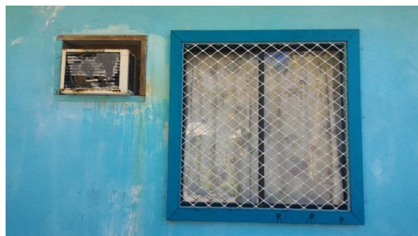
圖說：老舊冷氣外觀