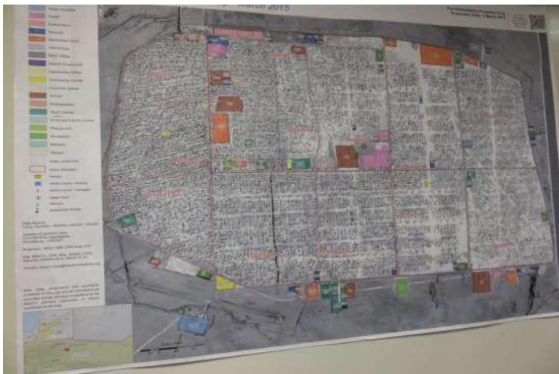
圖 16 Zaatari 敘利亞難民營地圖