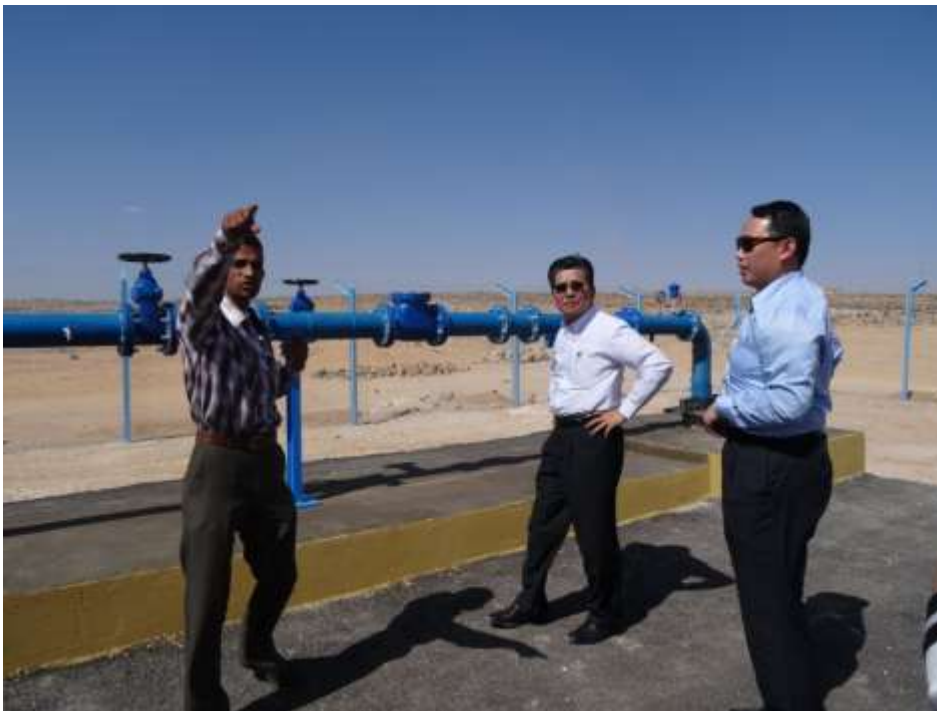
圖 5 及圖 6 Kufr Asad 7 號水井、Aqeb K117 號水井