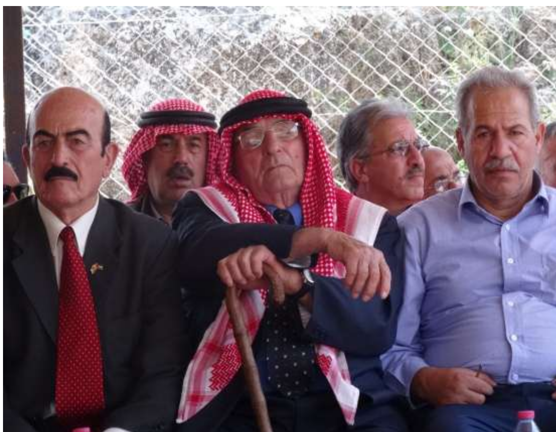
圖 9 及圖 10 Kufri Asad 7 號水井竣工啟用典禮與會貴賓