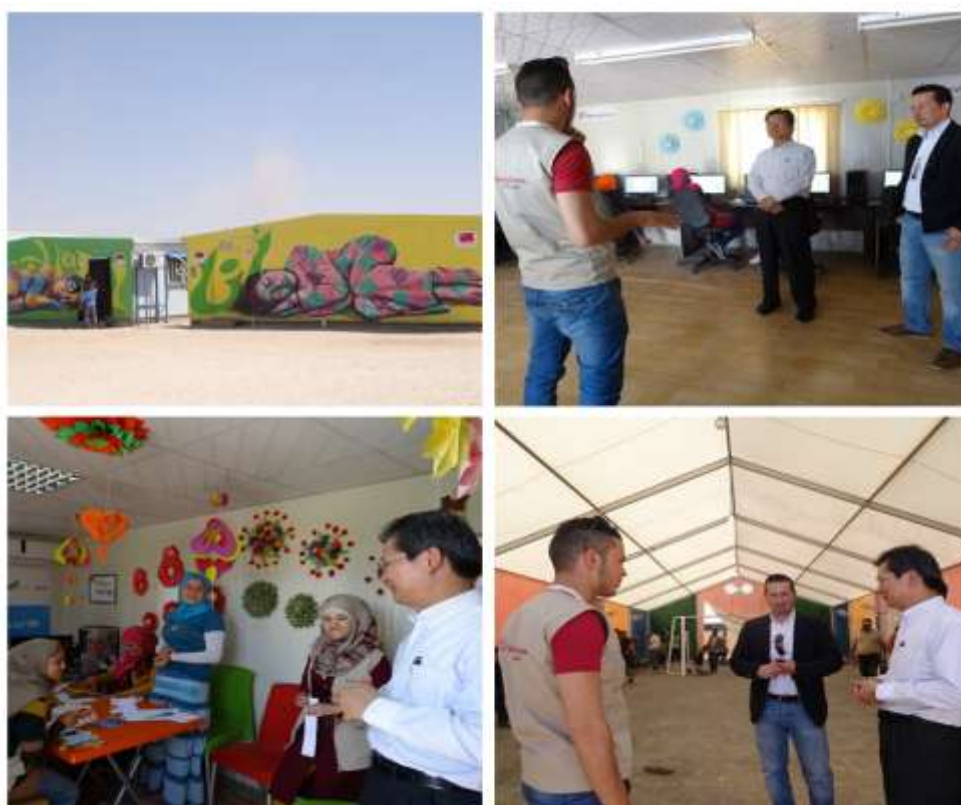
圖 7 及圖 8 Zaatari 敘利亞難民營