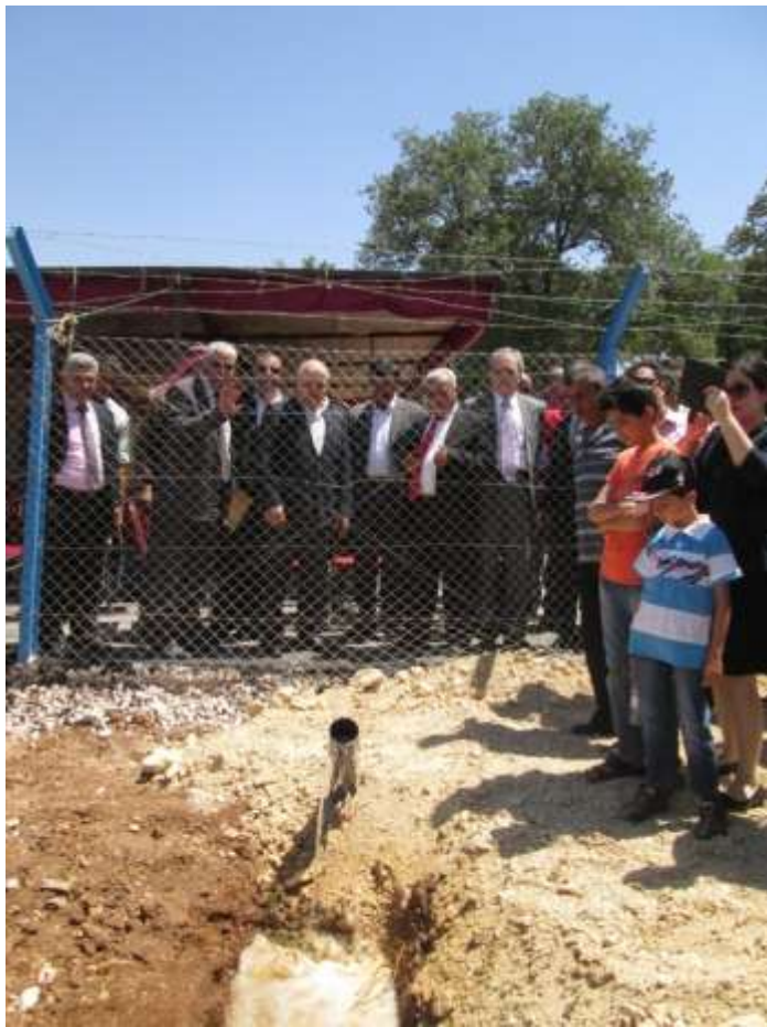
圖 13 及 14 Kufr Asad 7 號水井竣工啟用