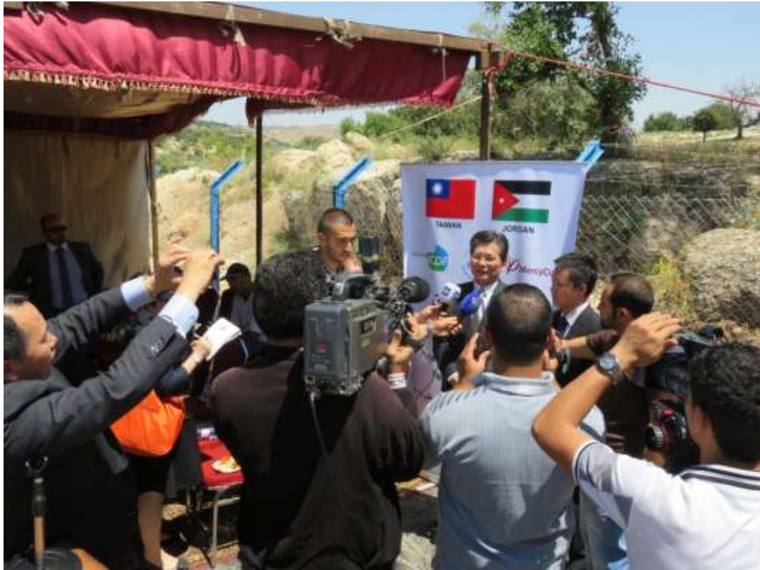
圖 4 本會施秘書長接受當地媒體訪問