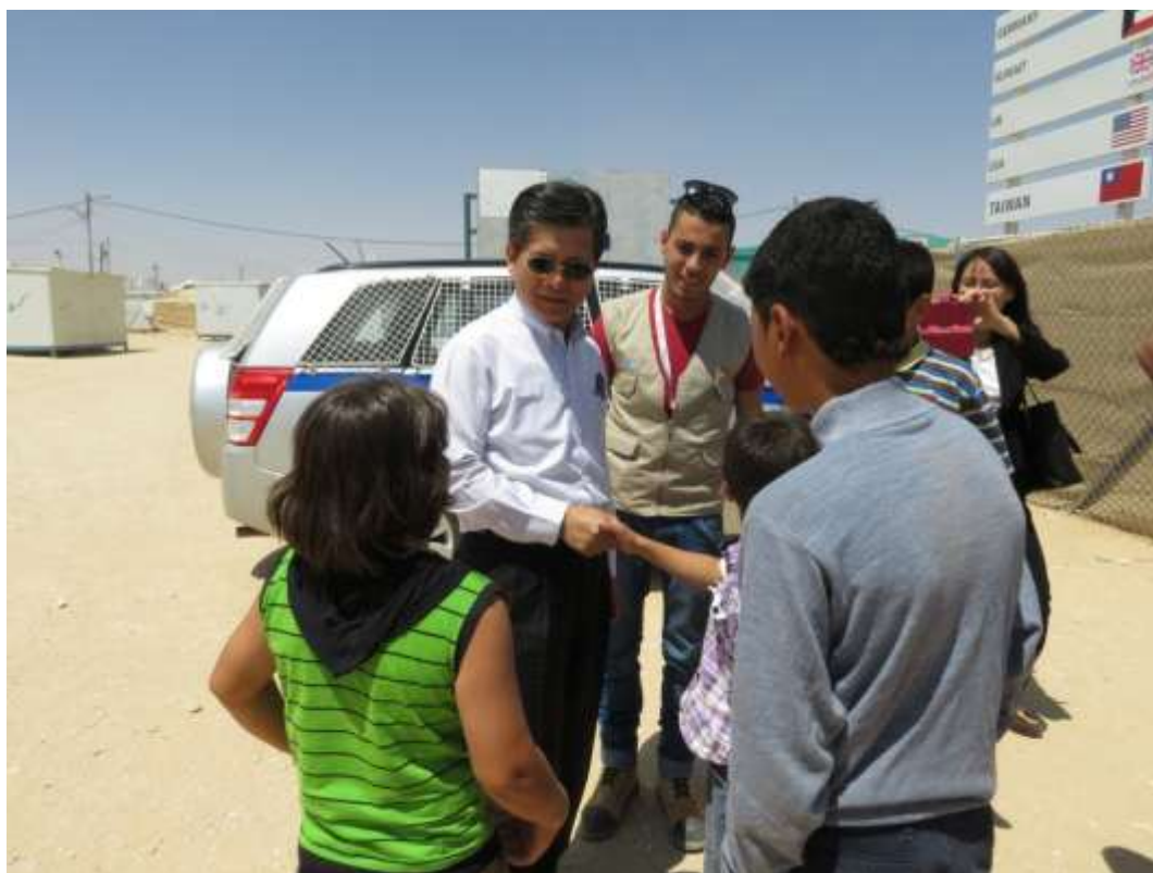
圖 17 本會施秘書長與 Zaatari 敘利亞難民營小朋友互動