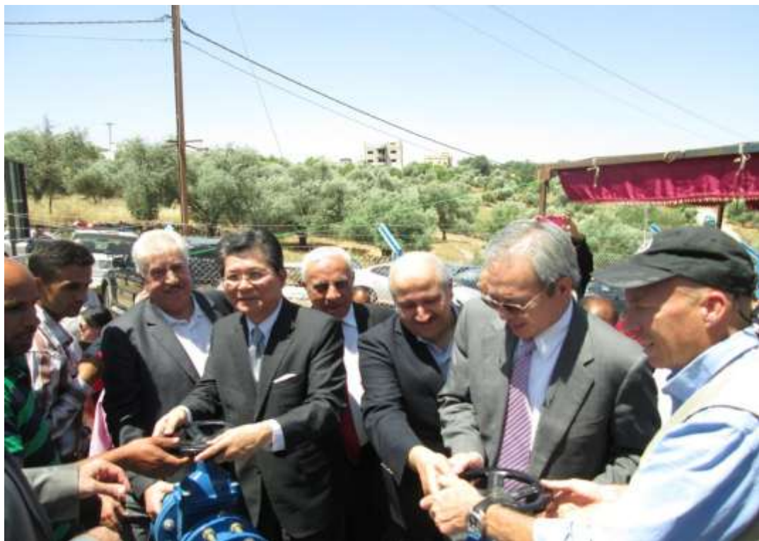
圖 2 及圖 3 Kufr Asad 7 號水井竣工啟用典禮