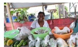
貿易援助與永續發展