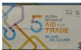
全球貿易援助檢視會議