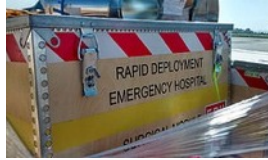
人道援助需求激增