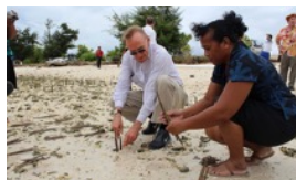
南太與政府開發援助