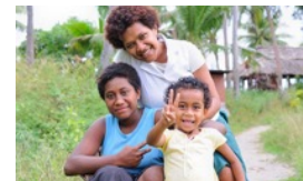
中日加強南太援助