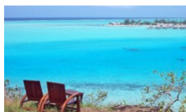
氣候變遷對南太衝擊