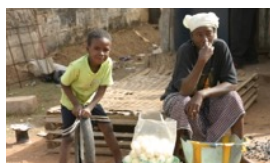
世界越來越平 人越來越窮?