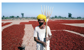
全球化下的糧食交易