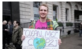
會議核心： TRUST AND MONEY