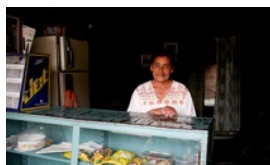
微小中企業拉美經濟骨幹