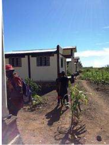
亞氏舊宅前之家庭菜園