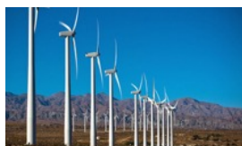
17個目標 More Or Less?