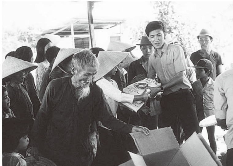
◀ 駐越南農耕隊人員分發玉米種子予農民